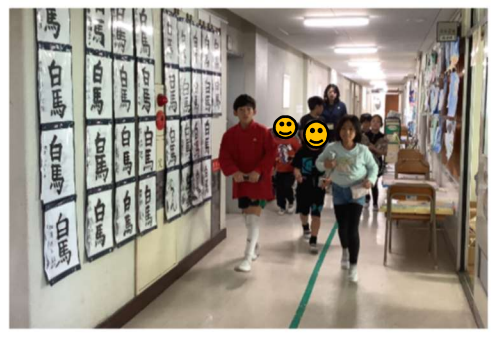
たてわり集会でクイズラリーを行いました！