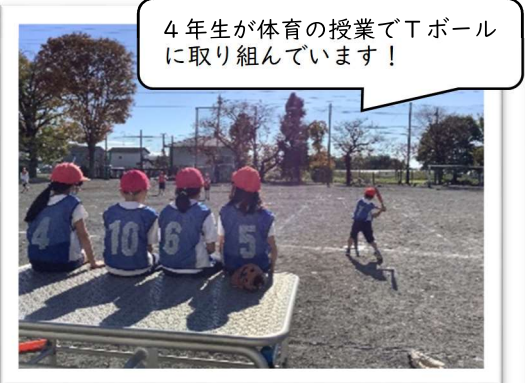
4年生が体育の授業でTボールに取り組んでいます！