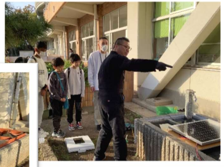
真剣に考えています。みんな、とても楽しそう！