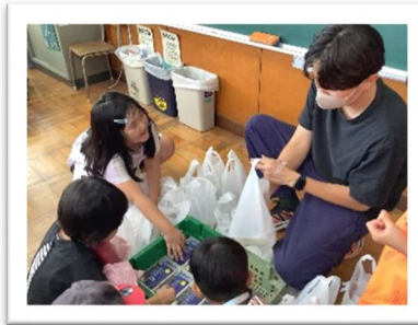
今年度も市内の豆腐製造会社様より十五夜豆腐をいただきました！