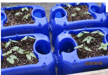
ぐんぐん育つ2年生のミニトマト

いつも通りに進められないことはたくさんありますが、子どもたちが再び笑顔で学校生活を送れるように全職員で知恵を絞り、力を合わせて進めてまいりますので、ご理解・ご協力くださるようお願いいたします。