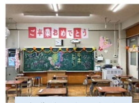
卒業式の朝の教室

朝から雪がちらちらと舞い降りていた3月19日に、有馬小学校を6年生43名が巣立っていきました。卒業までのカウントダウンが始まって3ヶ月弱、月日はあっという間に流れていきました。卒業証書を受け取る凜とした姿、小学校生活への思いを形にした呼びかけ、美しいハーモニーを響かせた卒業の歌。卒業生が見せた立派な姿に、子どもたちの大きな成長を感じました。在校生代表として式に参加した5年生の呼びかけや歌も、心のこもった素晴らしいものでした。6年生から伝統というバトンを受け取りました。きっと、有馬小学校の子どもたちをリードし、素敵な学校をつくっていかけてくれることと思います。心温まる感動的な式になりました。卒業生のみなさん、いつまでも応援しています！