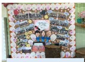
保護者の方手作りの メモリアルボード!!